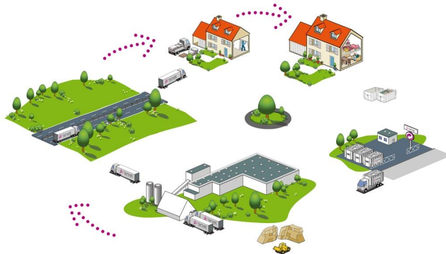
Schéma du cycle de vie